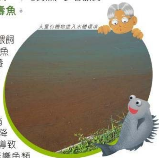
大量有機物進入水體環境

因此，養魚戶應實施良好的管理措施，以減低養殖活動所做成的自身污染，確保魚塘可持續有效使用。